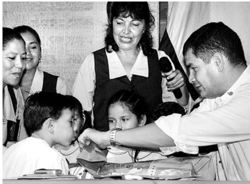
Bildung ist für Ecuadors Präsident Correa eine Herzensangelegenheit.

Umgekehrt hat Kuba eine wichtige Rolle bei diesen Alphabetisierungskampagnen gespielt – vor allem mit seinem Programm »Yo, sí puedo« (Ja, ich kann's). Ausgehend von einer Kampagne in Haiti wurde die audiovisuelle Methode von der kubanischen Pädagogin